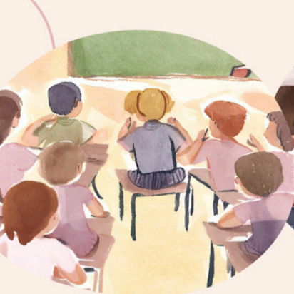
2 sezioni Per ciascuna classe