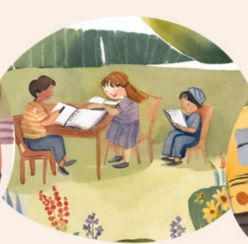
Servizio di post scuola