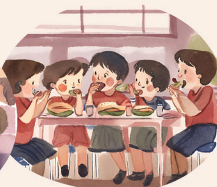
Mensa nei giorni di rientro pomeridiano